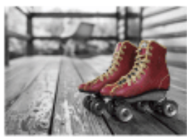
Quiz: Psychology 101 Part 2