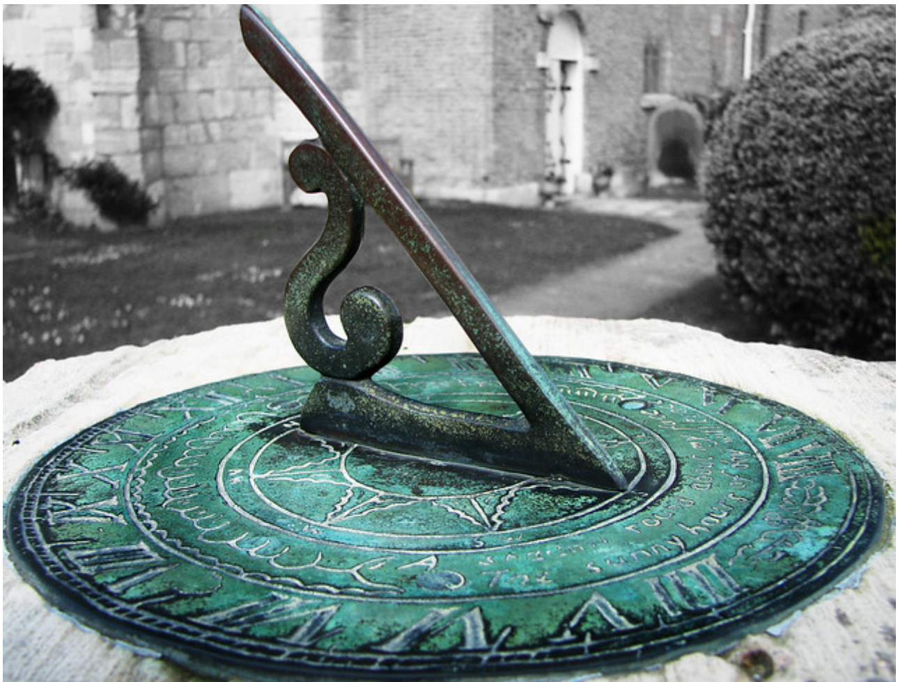
Create a Sundial, Peter Whelerton

Desde tiempos inmemoriales, los relojes de sol han sido utilizados para indicar la hora, permitiendo que las personas funcionen con un horario. Los antiguos babilonios, egipcios, griegos y mayas fueron algunas de las grandes civilizaciones que comprendieron que la posición del sol en el cielo y las sombras que proyecta podían ser utilizadas para hacer una estimación de la hora del día.