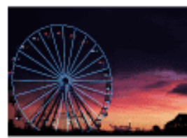
Quiz: Flags in Europe