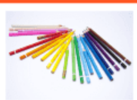
Quiz: Psychology 101 Part 2