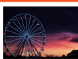
Quiz: Flags in Europe