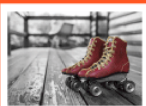
Quiz: Psychology 101 Part 2