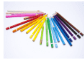
Quiz: Psychology 101 Part 2