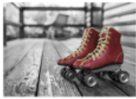
Quiz: Psychology 101 Part 2