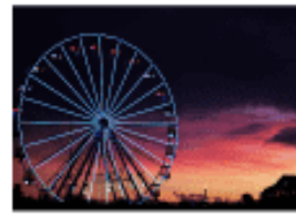
Quiz: Flags in Europe