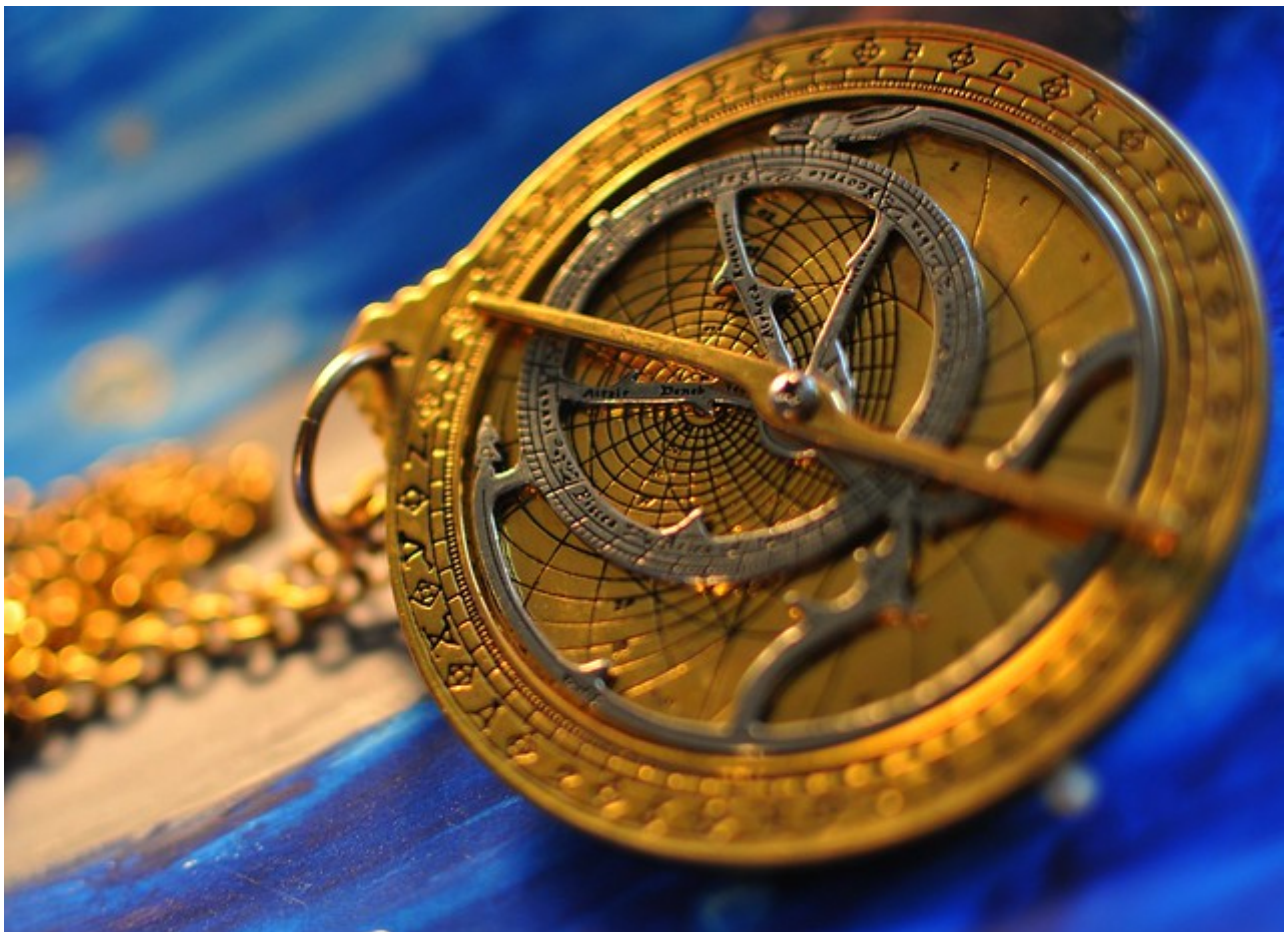
Chaucer's Astrolabe, Viewminder

El astrolabio es un aparato antiguo, utilizado durante mucho tiempo para medir la latitud y actuar como auxiliar en la navegación. Los historiadores creen que los primeros astrolabios fueron ideados por los antiguos griegos, entre los que encuentran los astrónomos Apolonio (262 a.C. - 190 a.C.) e Hiparco (190 a.C. - 120 a.C.), quienes desarrollaron la teoría detrás del dispositivo.